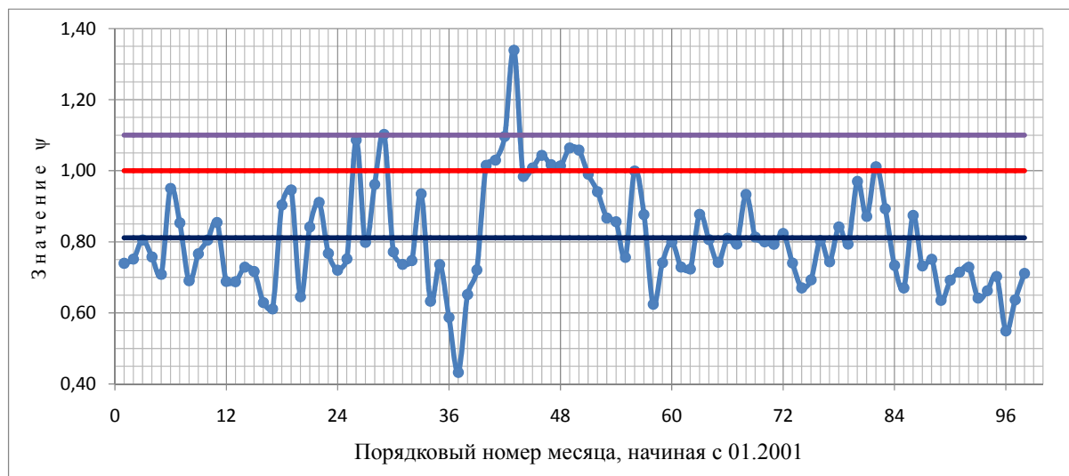
Рис. 2 – Хронологический график ход значений показателя \psi для санитарно-токсикологической группы веществ

На рис. 2 приведен хронологический график хода значений показателя \psi , характеризующего содержание веществ санитарно-токсикологической группы